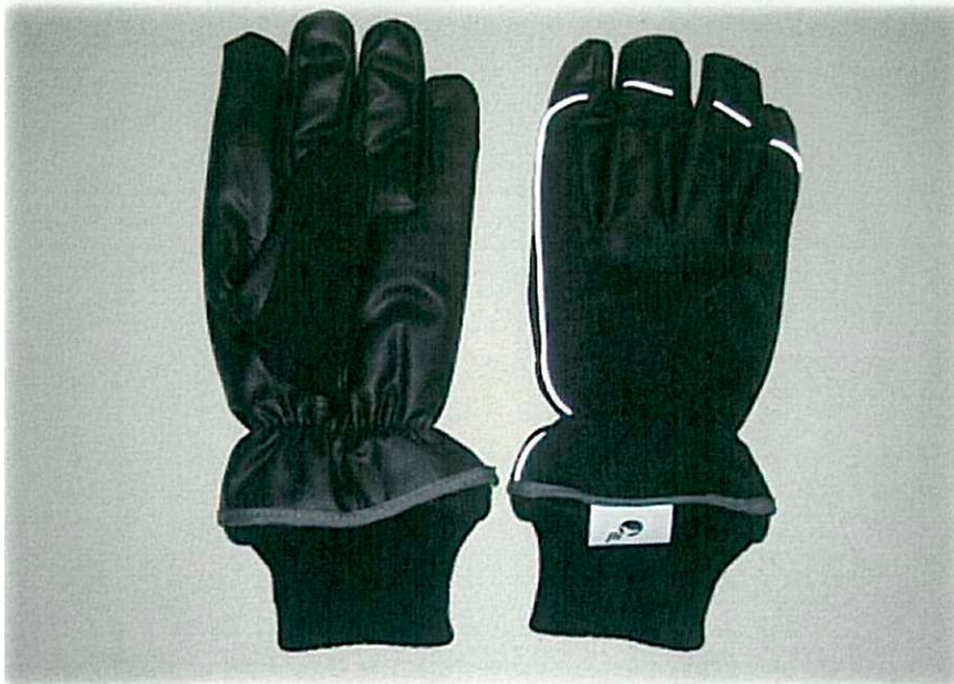
Imaginea 1: Dosul palmei mănușilor